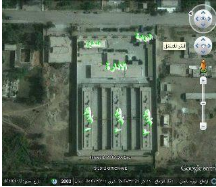
معتقل أبو زعبل شديد الحراسة.